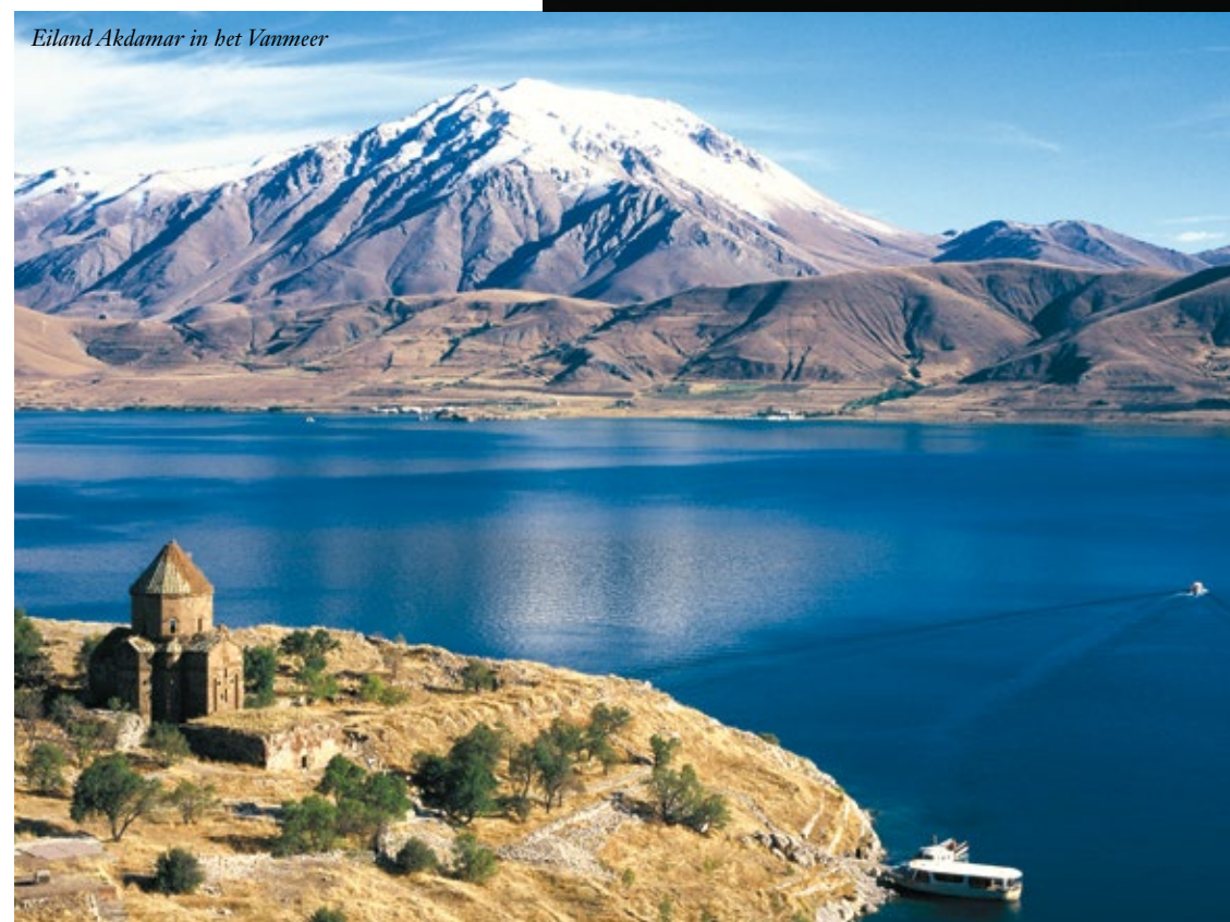
Eiland Akdamar in het Vanmeer

Nationaal park Yedigöller is zonder twijfel een van de meest gefotografeerde landschappen van Turkije. De zeven meren die